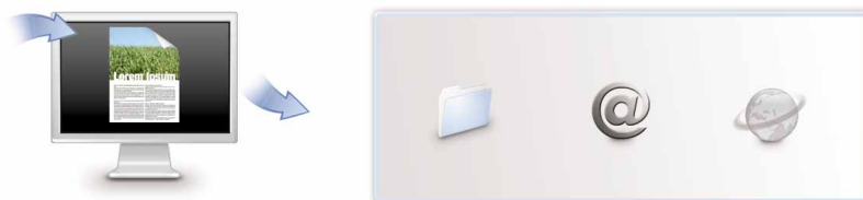
Scan-to-E-Mail, Scan-to-Folder und Scan-to-URL per Tastendruck