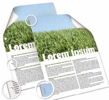
Heftet und locht die Ausgabe

Für die MP C2050/MP C2550 wurde ein spezieller interner 500-Blatt-Finisher entwickelt, der sowohl heftet als auch locht. Neben einer ausgezeichneten Druckqualität und Medienverarbeitung verfügen Sie über den perfekten Partner für die Produktion von Bürodokumenten. Schränken Sie das Dokumentoutsourcing ein, und erstellen Sie firmenintern professionell gestaltete Dokumente.