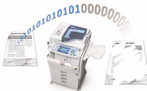
HDD Data Overwrite.

Authentifizierungs- und Verschlüsselungsfunktionen schützen Ihre vertraulichen Daten. Die Systeme MP C2050/MP C2550 sind kompatibel mit optionalen Sicherheitspaketen wie HDD Data Overwrite, Copy Data Security, Kartenauthentifizierung und Secure Print Release.