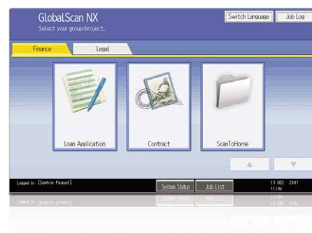
Benutzerfreundliche grafische Oberfläche.

Unsere intuitive Software GlobalScan NX strafft Ihren Workflow mit flexiblen Scan- und Verteilungsfunktionen. Ordnen Sie über eine benutzerfreundliche grafische Bedienoberfläche Funktionssymbolen ein spezielles Dokumentenformat und einen speziellen Workflow zu. Am Bedienfeld der MP C2050/MP C2550 erfolgt das Scannen jetzt in einem einzigen Schritt.